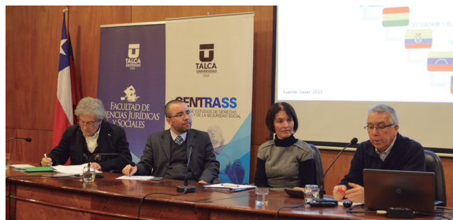
Expositores del Seminario Internacional sobre Trabajadores Migrantes.