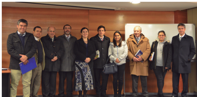
Capacitación CENTRASS Colegio de Abogados.