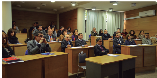
Coloquio sobre justicia vecinal.