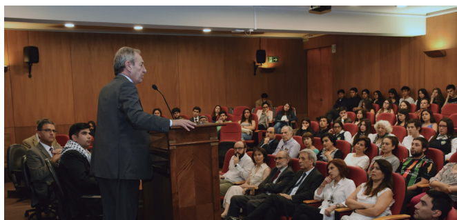
Conferencia del Embajador de Palestina, Imad Nabil Jadaa.