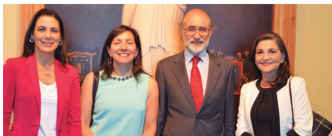
Lanzamiento libro "Estudios de Derecho de Familia".

Con este objetivo en mente, por las pantallas de en 2017 CAMPUSTV, canal de la Universidad de Talca, comenzó a ser emitido el programa llamado “Con Derecho a Saber”, compuesto por un conjunto de micro cápsulas a través de las cuales académicos de la Facultad abordan de manera didáctica materias jurídicas de interés para la comunidad.