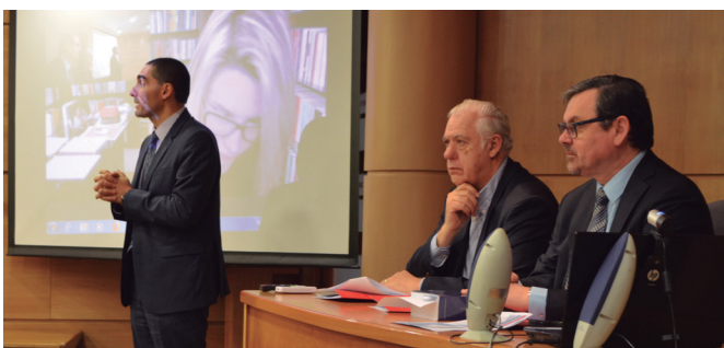
Seminario Internacional "Observando la jurisdicción constitucional latinoamericana".