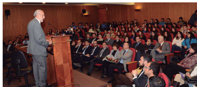
Fiscal Nacional, Jorge Abbot, en el Campus Talca.

Así, hasta la Escuela de Derecho del Campus Talca llegó el Fiscal Nacional Jorge Abbott Charme, quien dictó la clase magistral “Gestión estratégica