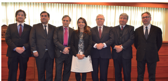
Seminario sobre Justicia Local, en la I. Corte de Apelaciones Talca.